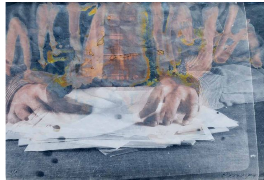
Baranyay András: Önarckép papírlapokkal, 1973 körül, ezüstszelatin nagyítás, dokubrom papír, 26 × 39,5 cm, MissionArt Galéria / HUNGART © 2023

Vegyük csak kézbe a fotóvonatkozású publikációikat, az eddig megjelent négy vastag kötetet: az Ujj Zsuzsiról szólót, amely a 2012-es revelatív kiállításához kapcsolódott, a Kocsis Imréről 2018-ban, Szabados Árpádról 2022-ben kiadottat, illetve a legvastagabbat,