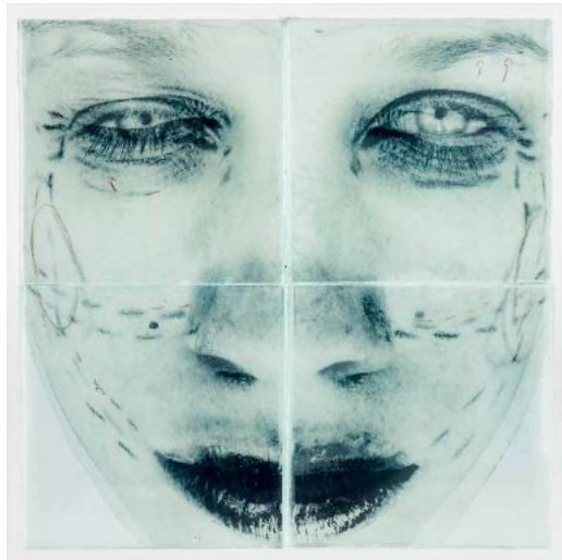
Verebics Ágnes: Szabásminta, 2010, plexi, fólia, C-print, 28,5 × 28,5 cm, MissionArt Galéria / HUNGART © 2023