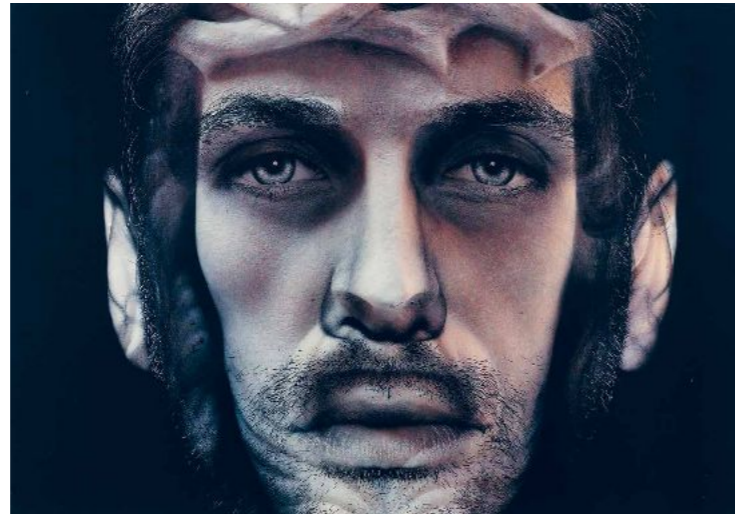
Csontó Lajos: Zene No. 1., 2006, C-print, dibond lemez, 70 × 100 cm, MissionArt Galéria / HUNGART © 2023

kezdve »belemásztam«. Megrózsasztam az egészet, vagy rányomtatam áttetsző litográffestéket, amiktől olyan lett, mint a kő színe, szép összefüggő, egyenletes tónusú. Mindig úgy kezelem, hogy ez is éppúgy képelőállítási módszer, mintha ceruzával dolgoznék. 7 A MissionArt gyűjteményében szintén igen sok munkával szereplő Gémes Péter számára is az egyetlen hely, ahol a számára adott világban modellje és filozófiája szabadon mozoghatott: a műterem. Amikor a festészeti-grafikai technikákat elhagyva fotóra váltott, a fekete-fehér fényképezés minden mediális sajátága, a kép pillanathoz kötöttsége, a képtér rétegzett mélysége, a szürkeskála kivételes gazdagsága alkalmasnak bizonyult arra, hogy a létrehozás hitelességének és a létrejött elvonságának termékeny konfliktusát a végtelenségig szítsa. „A műteremben született művet tehát végtelen manipuláció tárgyakként kell látnunk. Hogy ez bekövetkezhesen, a munkát előállítás pillanatától kezdve el kell szigetelni a való világtól. Ugyanezen oknál fogva a műteremben