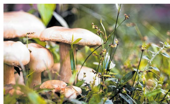
Nem ismeri fel? Ne egye meg, míg gombavizsgáló nem látta!

Régebben több gombavizsgáló hely volt, ma már saj-