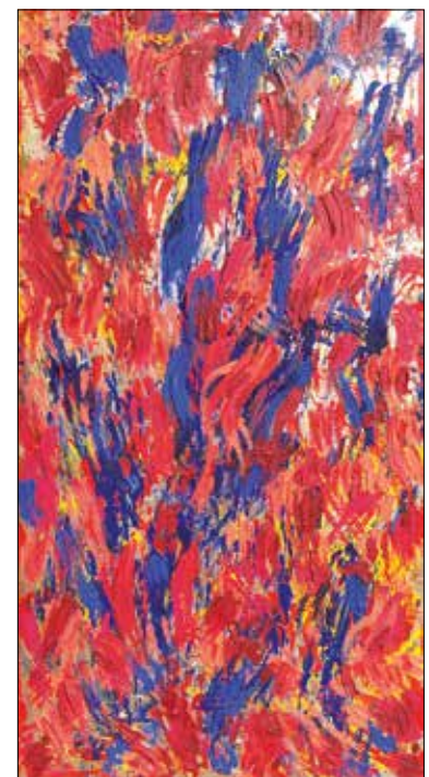
Swierkiewicz Róbert: Venyigetűz (meditációs fatábla), 2001 olaj, fa, 150,5x79 cm

Swierkiewicz sosem volt trendi, és sosem akart – de nem is tudott volna – közvetlenül kapcsolódni valamely stílushoz vagy irányzat-