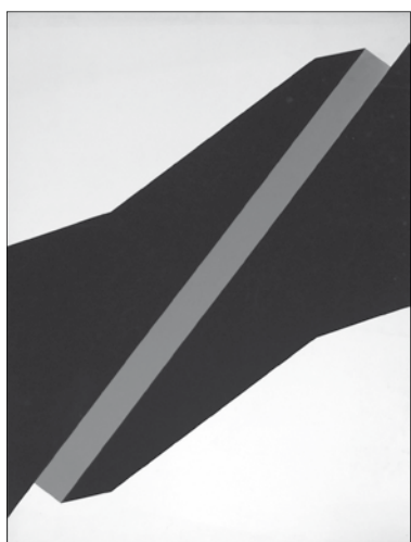
Nádler István: Megtört átló III., 1974 szitanyomat, 69,5x52,5 cm

A Műhely bemutatóhelye az 1976–1988 között Fajó vezetésével működő Józsefvárosi Galéria lett. 1977-ben A színes sokszorosítás szerepe korunk vizuális gondolkodásában címmel rendezték meg közös kiállításukat. A galéria a kor néhány nyitott szellemű entellektüeljének is munkahelyet adó Népművelési Intézet kisgaléria-hálózatába tarto-