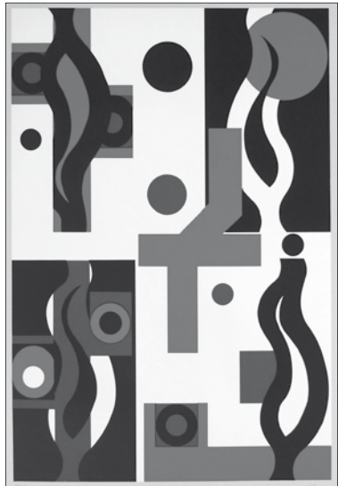
Nicolas Schöffer: Varigráfia I., 1987 szita, papír, 46,5x32 cm

Az első szitamappát 1968-ban készítette el Bak Imre, Fajó János, Molnár Sándor és Nádler István, majd ők lettek a technika hazai diadalra vivői. Utóbb Hencze Tamással, Keserü Ilonával és Mengyán And-