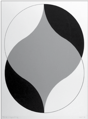
Fajó János: Metsződés, 1985 szita, papír, 59x64,5 cm

A MissionArt felvette az elejtett szálát, és Fajó János gyűjteménye alapján bemutatja ezt az immár történetileg fontos szerigrafia-anyagot. A projekt három, kéthetenként egymást követő kiállításra tagolódik: Fajó János szitanyomatai (április 1–15.); A Pesti Műhely magyar művészei (április 15–29.); Európai kollekció (április 29.–május 16.). Fajó jó gazdaként őrzi műterme fiókjában a szitanyomatokból közzétehető példányokat. Nemcsak spiritus rectora volt a magyar neoavantgárd konstruktivista szerveződéseknek, hanem személyében és gyűjteményében hiteles dokumentátora is ennek az anyagnak.